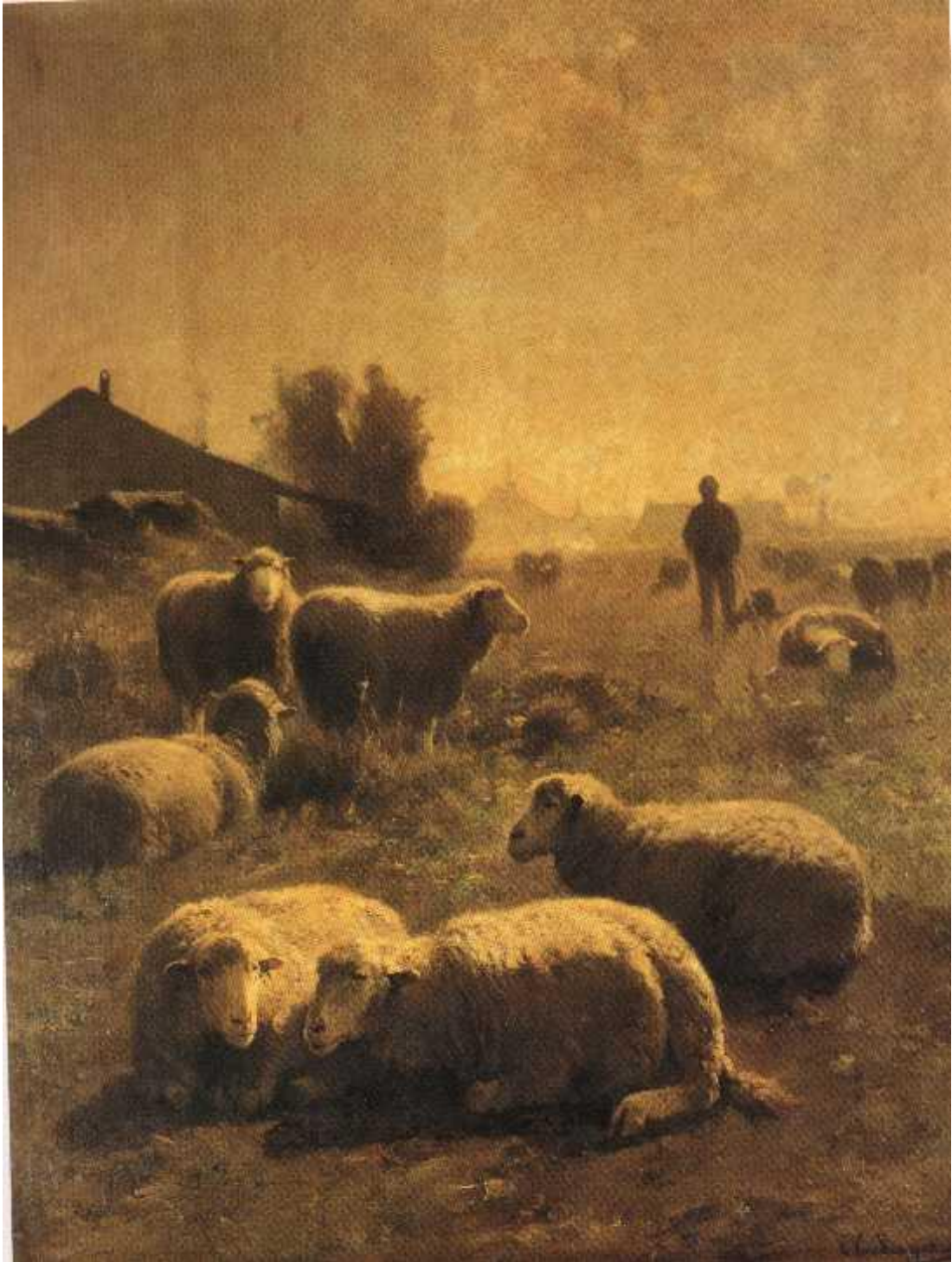
Figuur 5 : De kudde - Cornelis Van Leemputten