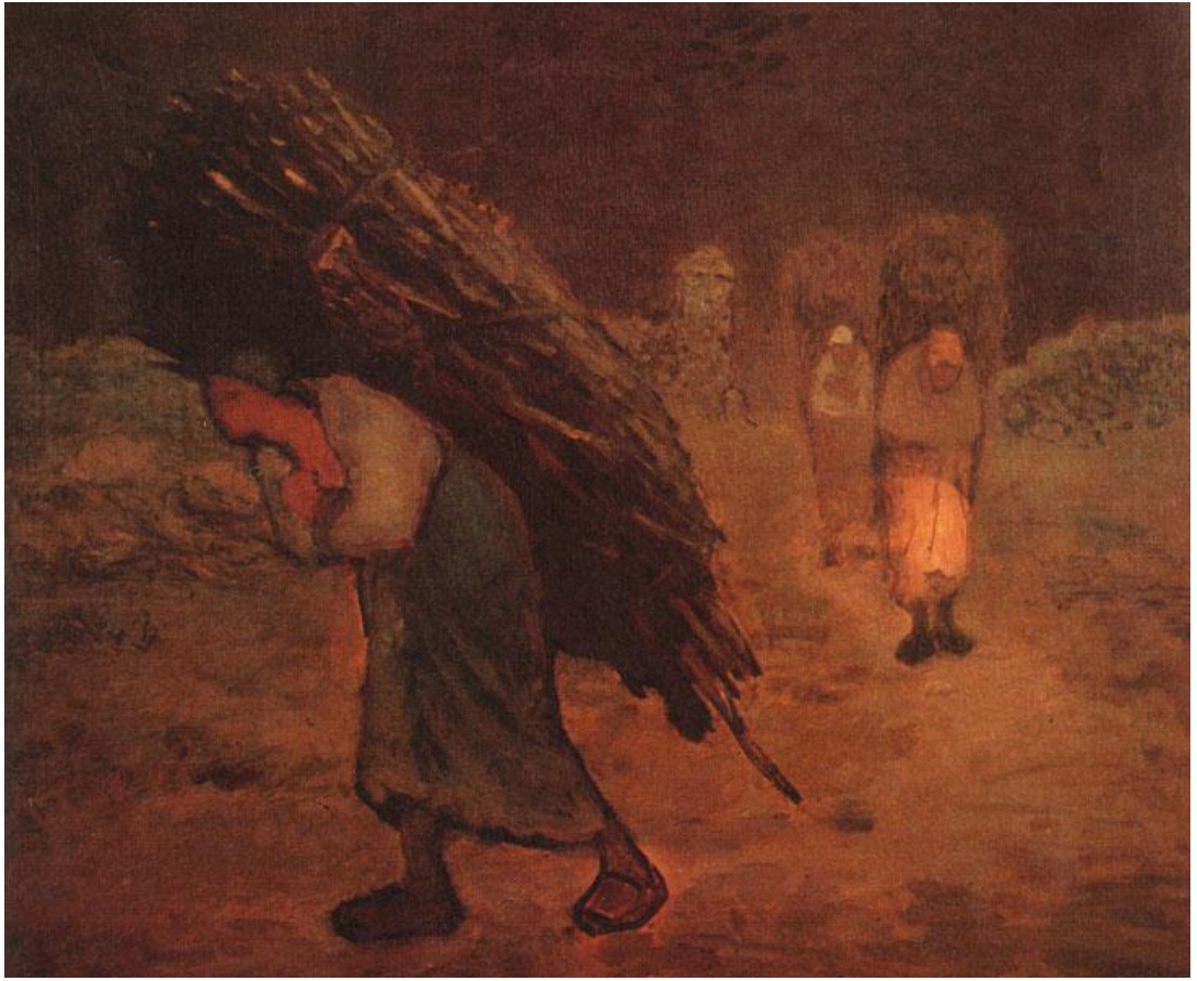
Figuur 6 : Millet Jean François ( 1814 – 1875)