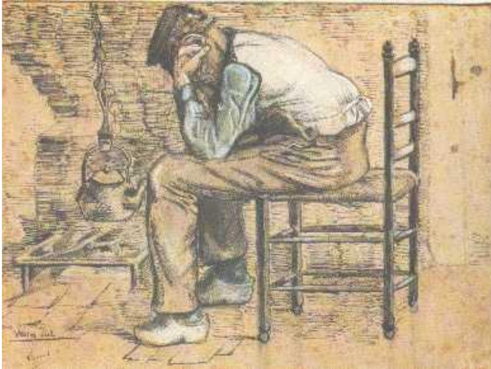
Figuur 11 : Worn Out - zomer 1881 - Vincent Van Gogh