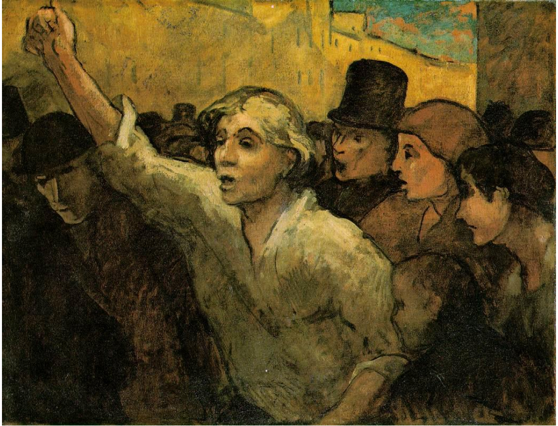
Figuur 12 : De Opstand - 1860 - Honoré Daumier