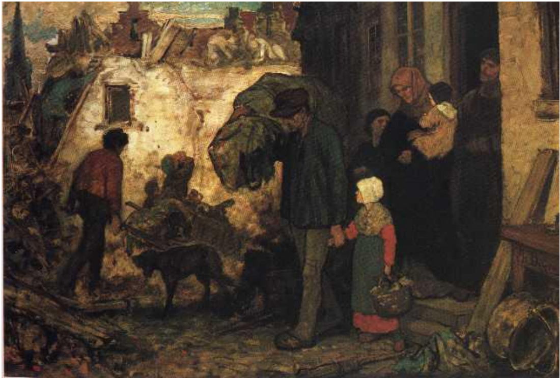
Figuur 8 : De uitdrijving - Charles De Groux