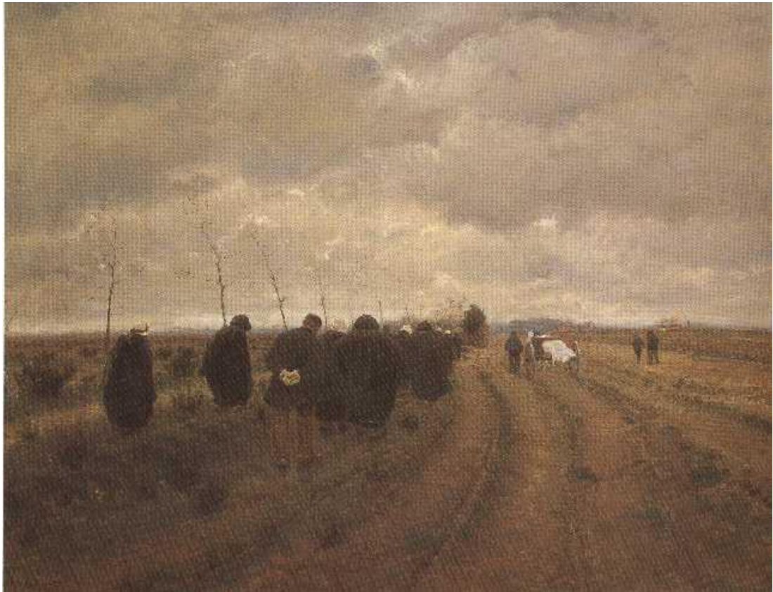
Figuur 9 : Begravenis in de Kempen - 1887 - Theodoor Verstraete