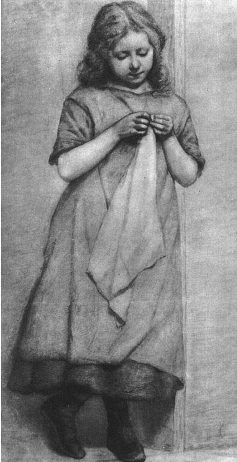
Figuur 7 : Jong naaistertje - Matthijs Maris (1839 - 1917)