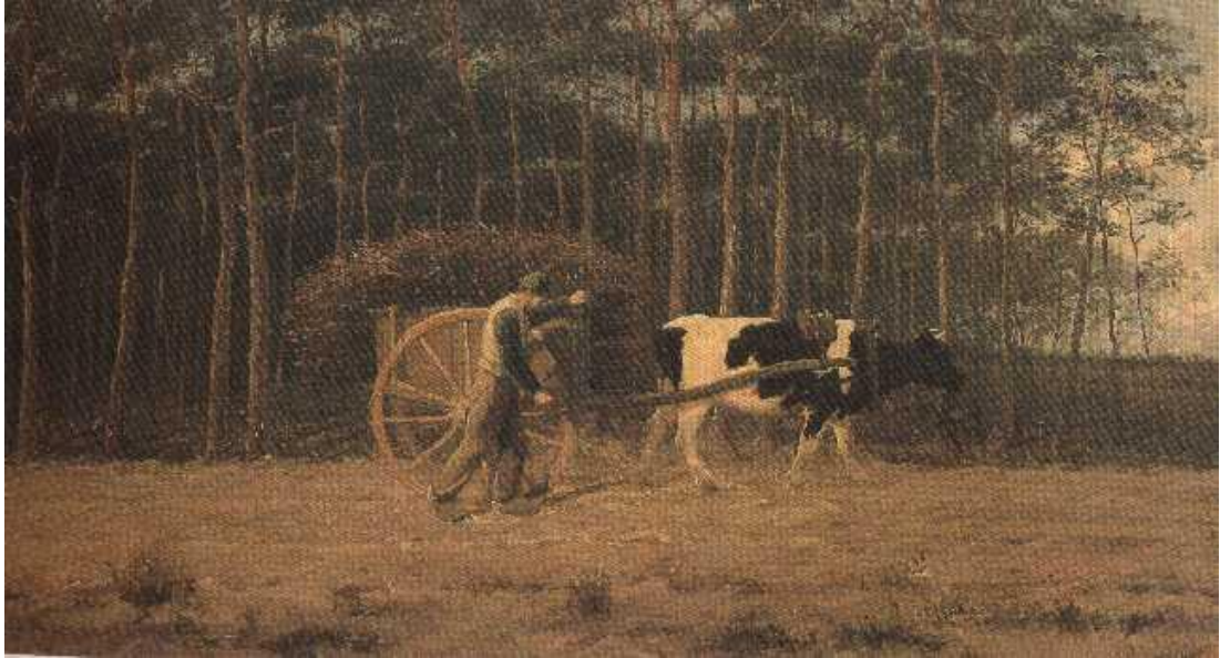
Figuur 2 : Gespan in de avond - voor 1895 - Theodoor Verstraete