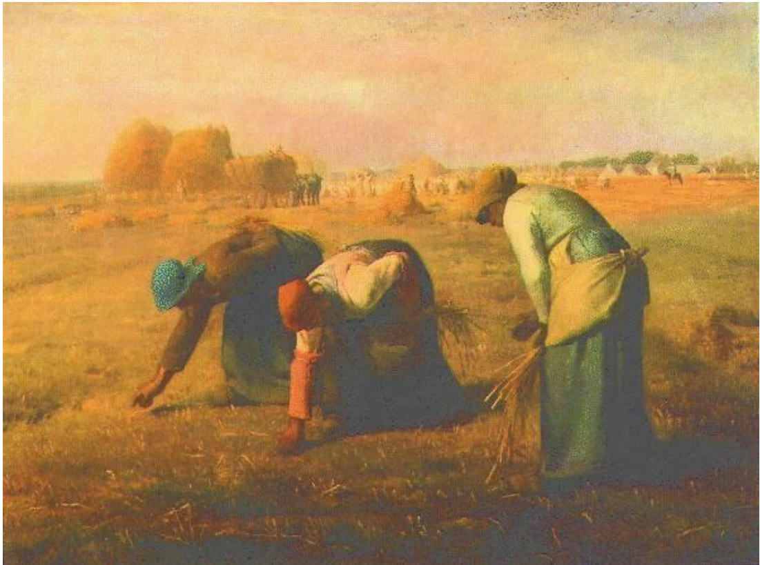
Figuur 1 : Les Glaneuses - 1857 - Jean-François Millet