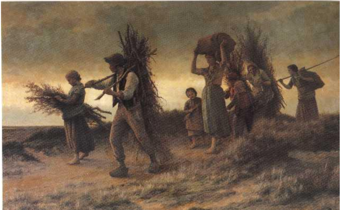
Figuur 3 : Een familie Kempische Houthakkers - 1888 - Frans Van Kuyck