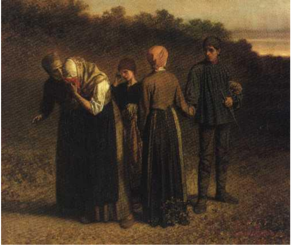
Figuur 4 : Afscheid (de loteling) - 1860 - Charles De Groux